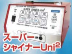
スーパー シャイナーUni 2