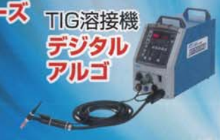
TIG溶接機 デジタル アルゴ