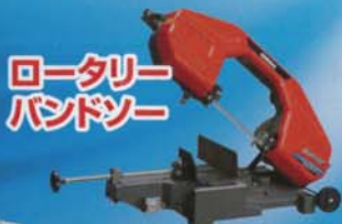
ロータリー バンドソー