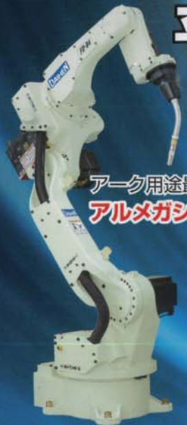
アーケ用途最適ロボット アルメガンシリーズ