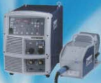
CO2/MAG自動溶接機 ウェルビーシリーズ