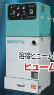
溶接ヒューム回収装置 ヒュームゼロ