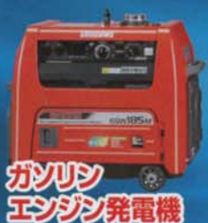
ガソリン エンジン発電機