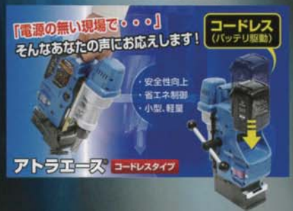
「電源の無い現場で・・・」 そんなあなたの声にお応えします!