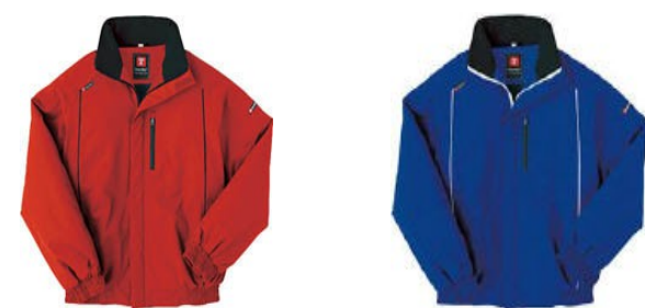
レッド AZ-8476-009-S~3L ブルー AZ-8476-006-S~3L