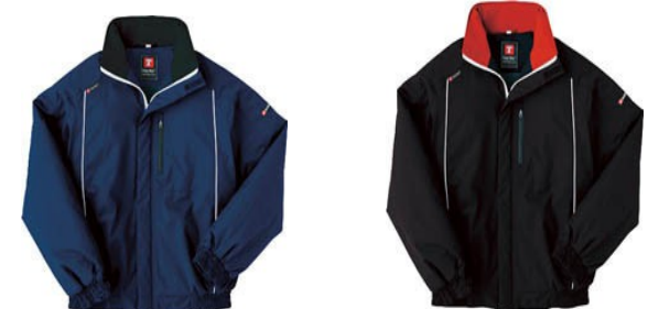
ネイビー AZ-8476-108-S~3L ブラック AZ-8476-010-S~3L