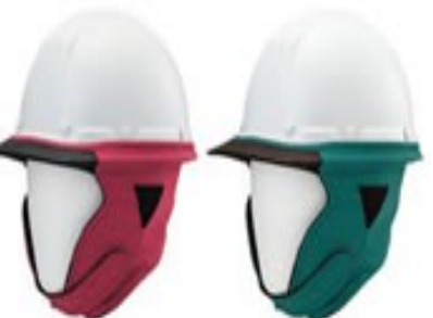
ワインレッド 421-4463 ブルーグリーン 398-5784