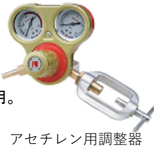
アセチレン用調整器

性能・使い易さ本位の調整器。 使用圧力範囲が一目でわかる安全ガイド表示目盛り。 保護用ガットハット付。 ガット式継手に締め付け強化方式(フリースライド)を採用。 認定番号8605-S2(酸素用) 認定番号8605-AC2(アセチレン用)