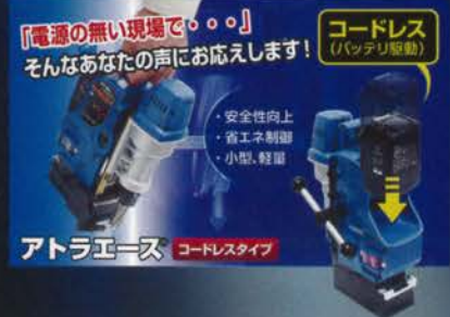
「電源の無い現場で・・・」 そんなあなたの声にお応えします!