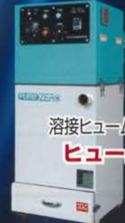
溶接ヒューム回収装置 ヒュームゼロ