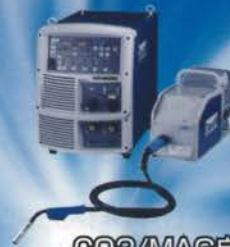
CO2/MAG自動溶接機 ウェルビーシリーズ