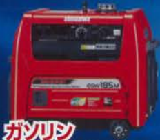
ガソリン エンジン発電機