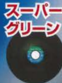
スーパー グリーン