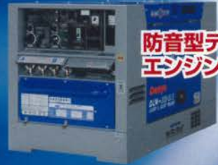
防音型ディーゼル エンジン溶接機