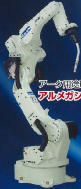
アーク用途最適ロボット アルメガンシリーズ

ダイヘン溶接メカトロシステム デンヨー 日東工器 マツモト機械 ケミカル山本 ニューレジストン レチトン エクセル貿易 やまびこ産業機械