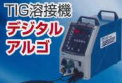
TIG溶接機 デジタル アルゴ