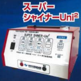
スーパー シャイナーUni 2