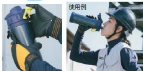
手袋をしたままでも楽に開閉可能 フタが大きく開きヘルメットを着用したままでも飲みやすい