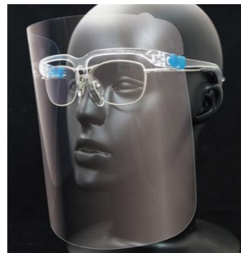
度付きめがねの上から掛けられる眼鏡併用タイプ

特長 「ズレない」「軽い」「かけやすい」 長時間の装着でも疲れのない軽量タイプです。 眼鏡の上からでも装着が可能です。 レンズ交換が可能です。