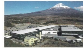
ウォーターサーバー製造工場 (パーパス株式会社)

外国製のウォーターサーバーが主流な中、「富士の湧水」は日本製のサーバーを採用しています。ポイントは「二重のチャイルドロック機能」と「自動クリーニング機能」。チャイルドロックを二重で搭載しているため、小さなお子様がいらっしゃる家庭でも安心です。自動クリーニング機能は週に一回自動でウォーターサーバー内に高温水を循環させて、機器内部をクリーンな状態に保ちます。